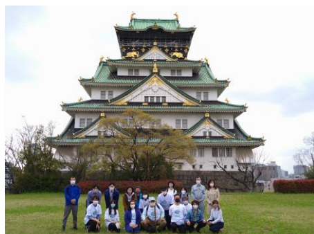
シート貼り付けのみなさま