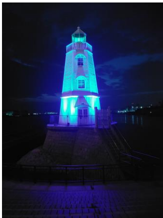
旧堺燈台、(主催堺市)