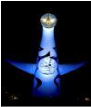
万博記念公園太陽の塔(吹田市)