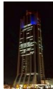
大阪府咲洲庁舎（大阪市住之江区）