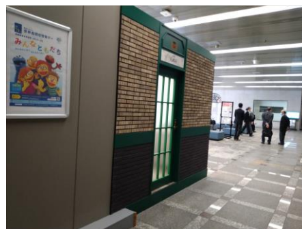
大阪役所ロビーホール(上写真)