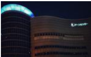
大阪府立男女共同参画・青少年センター（ドーンセンター）(大阪市中央区)