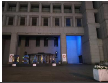
大阪市役所玄関前