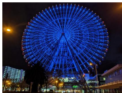
天保山大観覧車（大阪市）

令和3年4月2日撮影した写真です。太陽の塔、ドーンセンター、大阪府咲洲庁舎の写真は、大阪府提供していただきました。天保山大観覧車の写真は、大阪市提供していただきました。