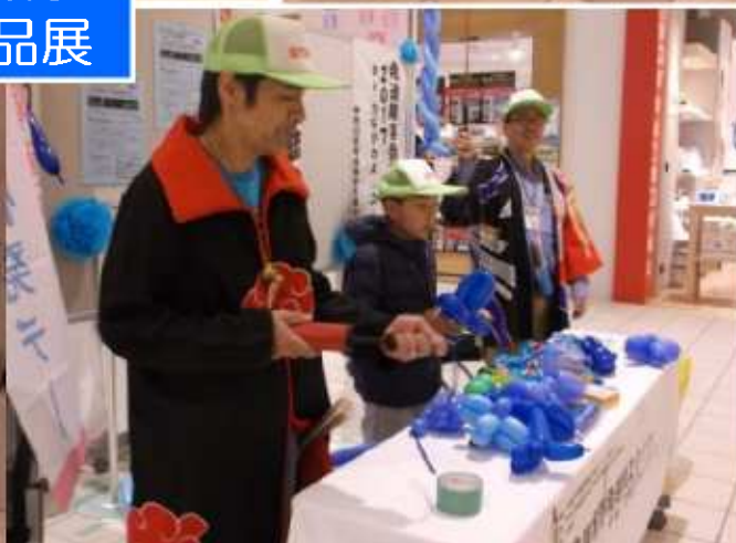
青色バルーンアートプレゼント 出演：綾瀬ジャグラーズミーティング