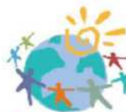
World Autism Awareness Day

社会の理解と合理的配慮を頂くため、啓発イベントを各地で開催します。皆さんの参加をお願いします!