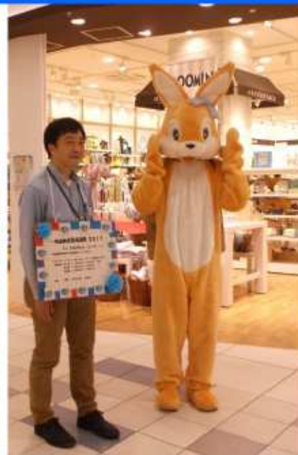
神奈川県自閉症児・者親の会連合会 2017.04.15 平塚地区自閉症児・者親の会 作品展