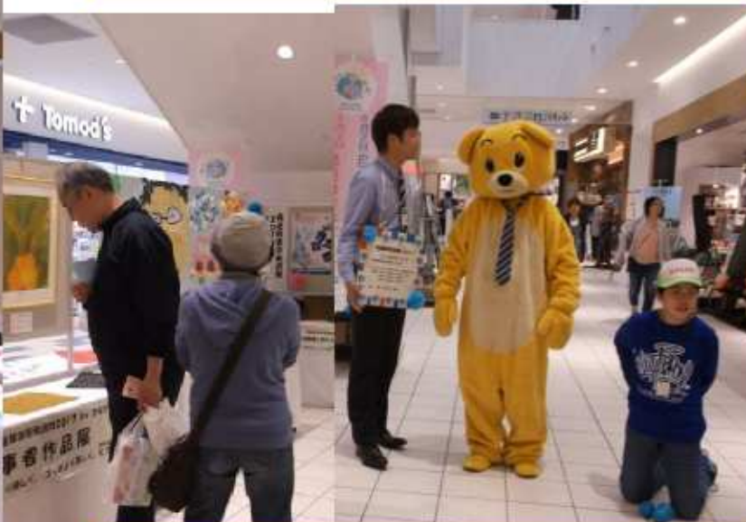
着ぐるみ出演も〔かながわA(エース)〕暑い中大変！